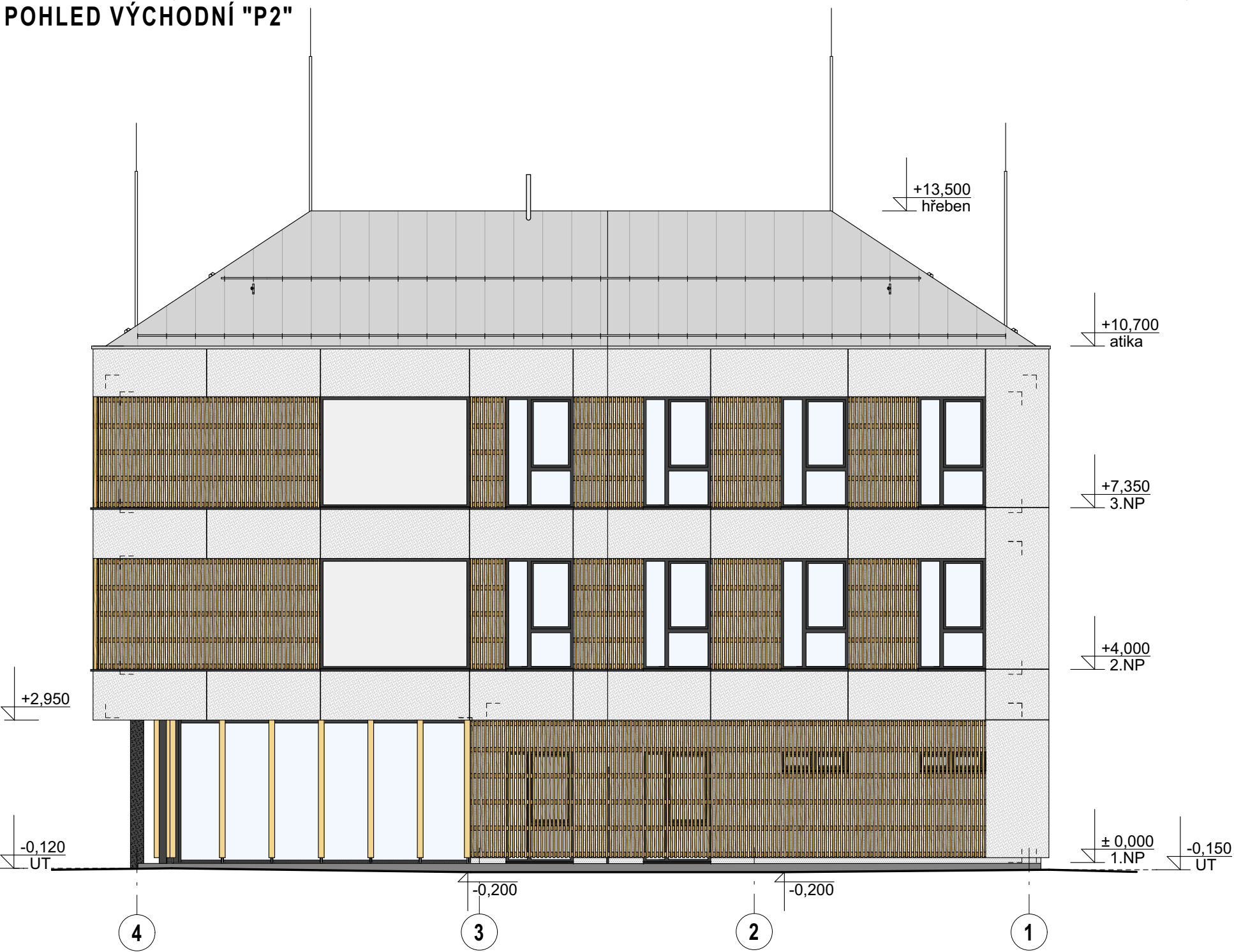
POHLED VÝCHODNÍ "P2"