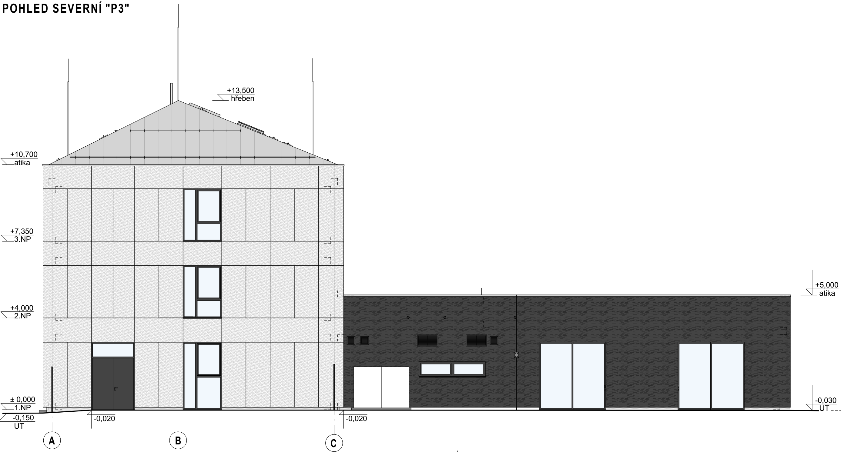
POHLED SEVERNÍ "P3"