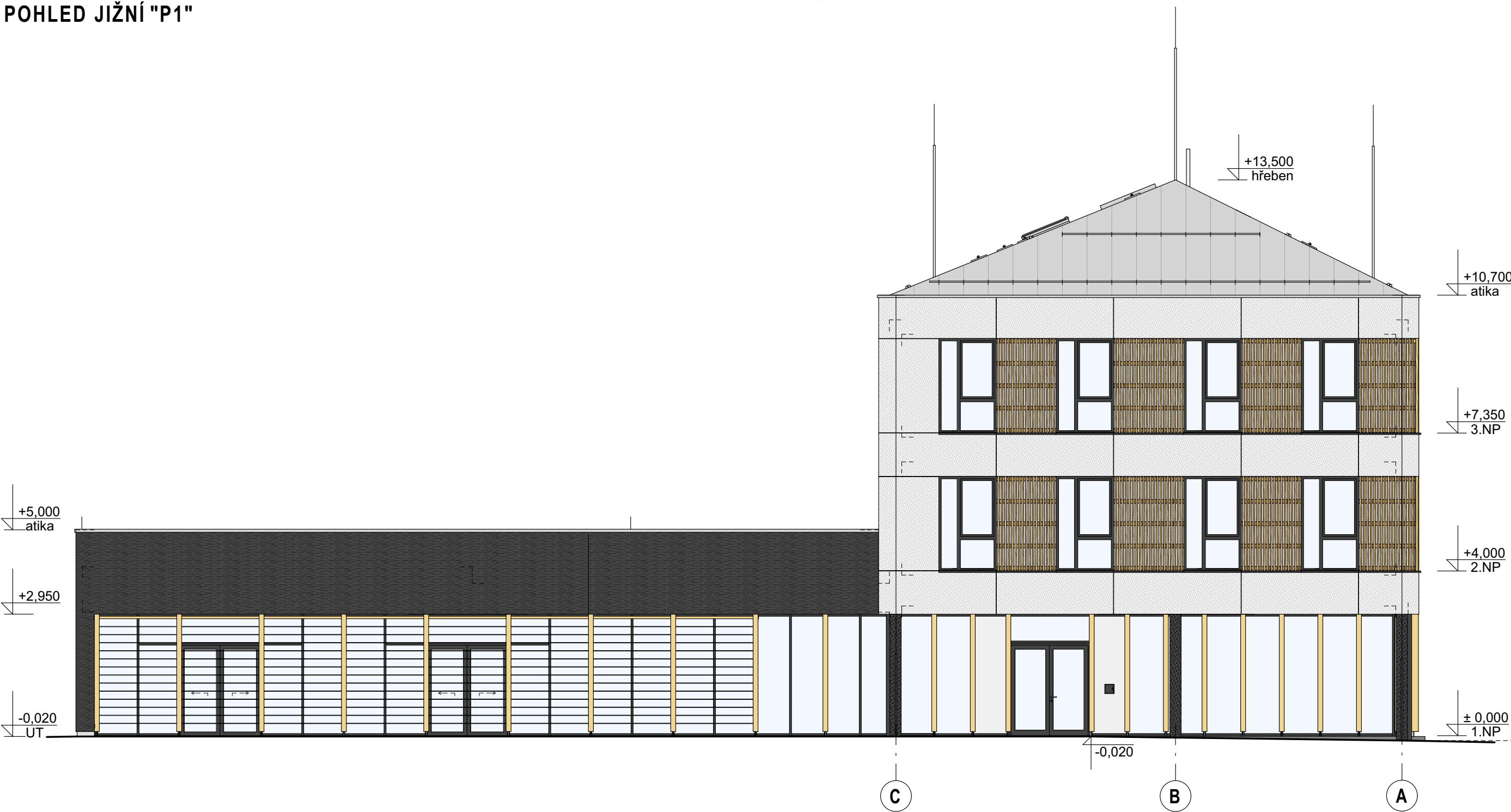
POHLED JIŽNÍ "P1"